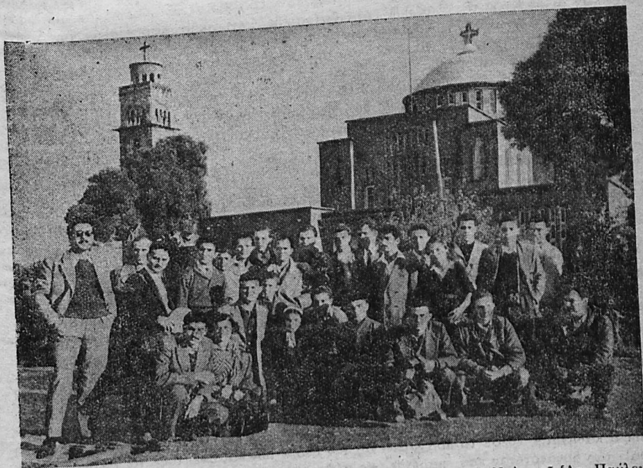
Ἐκδρομή σπουδαστῶν εἰς Κόρινθον. Εἰς τὸ βάθος ὁ Μητροπολιτικὸς Ναὸς τοῦ Ἁγ. Παύλου